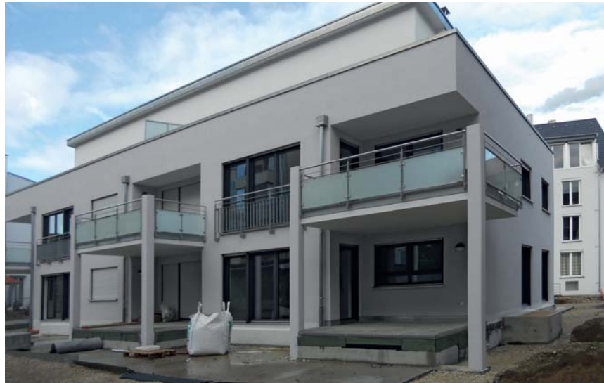
Flurstraße 24A, Rückseite

Die meisten Investitionen hat die GWF in den vergangenen Monaten in der Flurstraße in Stuttgart-Bad Cannstatt getätigt. Die acht Wohnungen im Neubau in der Flurstraße 24A konnten planmäßig im Januar und Februar 2015 bezogen werden.