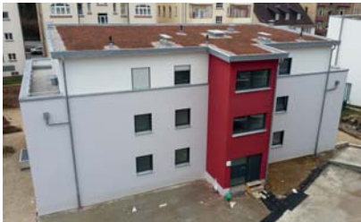
Flurstraße 24A, Vorderseite

Die meisten Investitionen hat die GWF in den vergangenen Monaten in der Flurstraße in Stuttgart-Bad Cannstatt getätigt. Die acht Wohnungen im Neubau in der Flurstraße 24A konnten planmäßig im Januar und Februar 2015 bezogen werden.