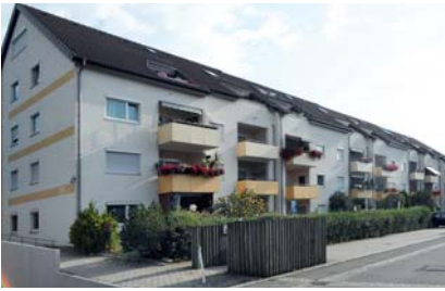
So sahen die Gebäude vor der Modernisierung aus: Links die Joachim-von-Schröder-Straße 3 – 13, rechts der Häselerweg 1 – 9

Die Joachim-von-Schröder Straße 3 – 13 in Leinfelden-Echterdingen und die Gebäude im Häselerweg 1 – 9 in Schwäbisch-Gmünd werden in diesem Jahr grundlegend modernisiert. Schwerpunkt ist die Verbesserung der Energieeffizienz: An beiden Standorten werden wir die Außenfassaden dämmen und 3-fach verglaste Fenster einbauen (teilweise mit elektrischen Rollläden). Beide Gebäude erhalten zudem eine innovative Zentralheizung sowie eine Dach- und Kellerdeckendämmung. Das